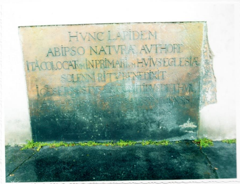
obrázek D. posvěcení vytesané v obrovském kameni