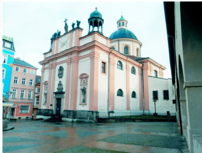
obrazek c1. a c2.