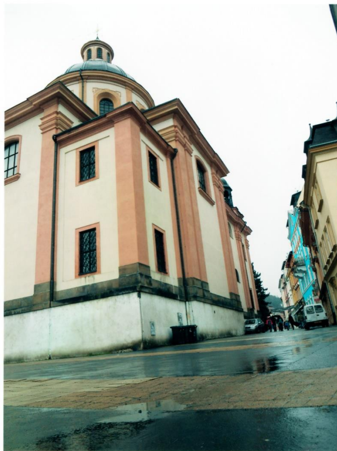
obrázek B. východní a jižní strana Kostela s ulicí Křížová